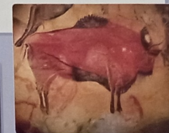
Malba z pravěké jeskyně Altamira ve Španělsku