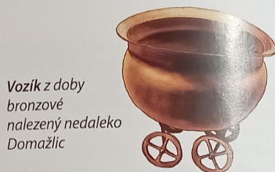
Vozík z doby bronzové nalezený nedaleko Domažlic