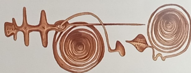
Jehlice z doby bronzové, která se používala k sepnutí šatů.